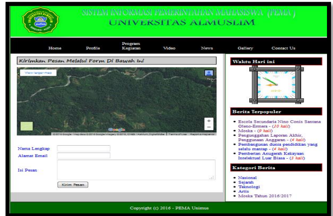
Gambar 6. Halaman Kontak

Halaman ini merupakan halaman yang menampilkan kontak person Pema Universitas Almuslim. Berikut ini tampilan halaman kontak.