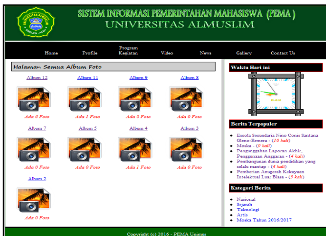
Gambar 5. Halaman Berita Tentang PEMA

Halaman ini merupakan halaman yang menampilkan galeri kegiatan Pema Universitas Almuslim. Berikut ini tampilan halaman galeri.