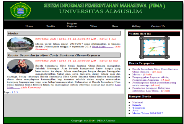
Gambar 1. Halaman Utama Sistem

Halaman ini merupakan halaman utama yang tampil di saat sistem dijalankan, pada halaman ini terdapat beberapa menu yaitu menu home, menu profil, menu program kegiatan, menu video, menu news, menu galeri, dan contact us. Agar lebih jelas dapat dilihat pada gambar berikut: