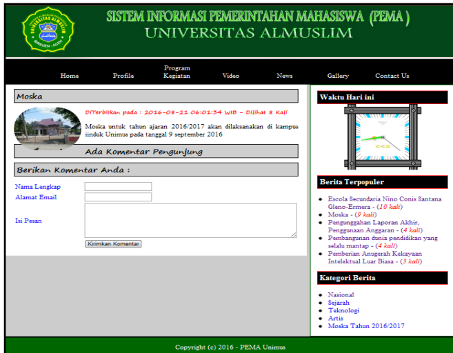
Gambar 4. Halaman Berita Tentang PEMA

Halaman ini merupakan halaman yang menampilkan berita tentang program kegiatan Pema Universitas Almuslim. Berikut ini tampilan halaman berita.