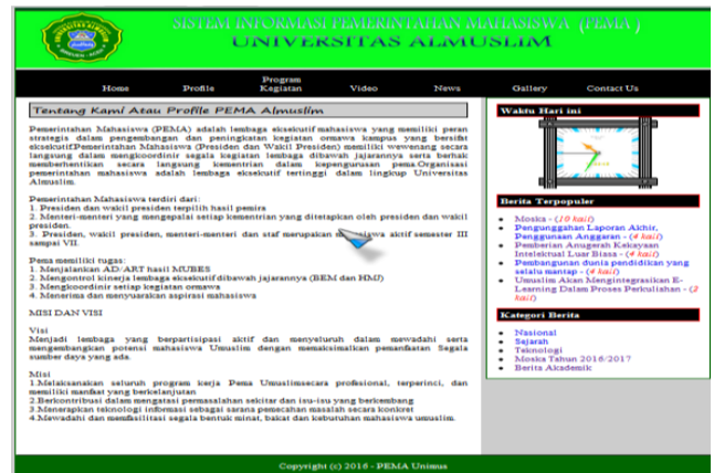
Gambar 2. Halaman Profil Pema

Halaman ini merupakan halaman yang menampilkan tentang profil Pema Universitas Almuslim, Sebagaimana gambar berikut :