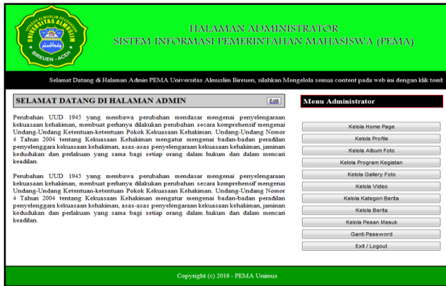
Gambar 8. Halaman Utama Admin

kegiatan, menu kelola galeri photo, menu kelola video, menu kelola kategori berita, menu kelola berita, menu kelola pesan masuk,, menu ganti password dan menu logout. Untuk lebih jelas dapat dilihat pada gambar berikut.