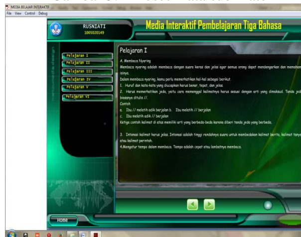
Gambar 5.3 Daftarmateribahasaindonesia