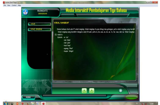
Gambar 5.4 Daftarmateribahasa Aceh