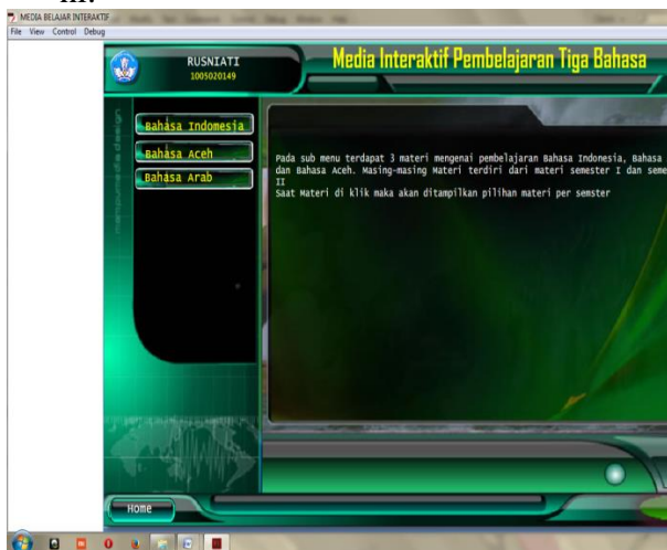
Gambar 5.2 Proses Data sub materi

1. Proses Tampilan Sub Materi Proses inidilakukanadmin oleh admin untuktampilan sub materi yang akandigunakandalam proses penentuanpembelajaraninteraktifbahasa indonesia, arab, acehberbasis multimedia. Data yang diprosesakandisimpankandalam sub materi. Proses data sub materidapatdilihatpadagambardibawahi ni.